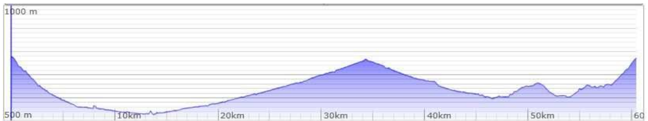
Aコースのプロフィール

コースはガッツリ走る A コースと、マッタリ走る B コースの2つが用意されていて、ワタシはもちろん Aコース!